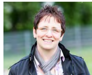
Leitung: Antje Vogel