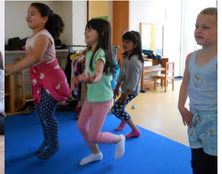
Musik und Tanz